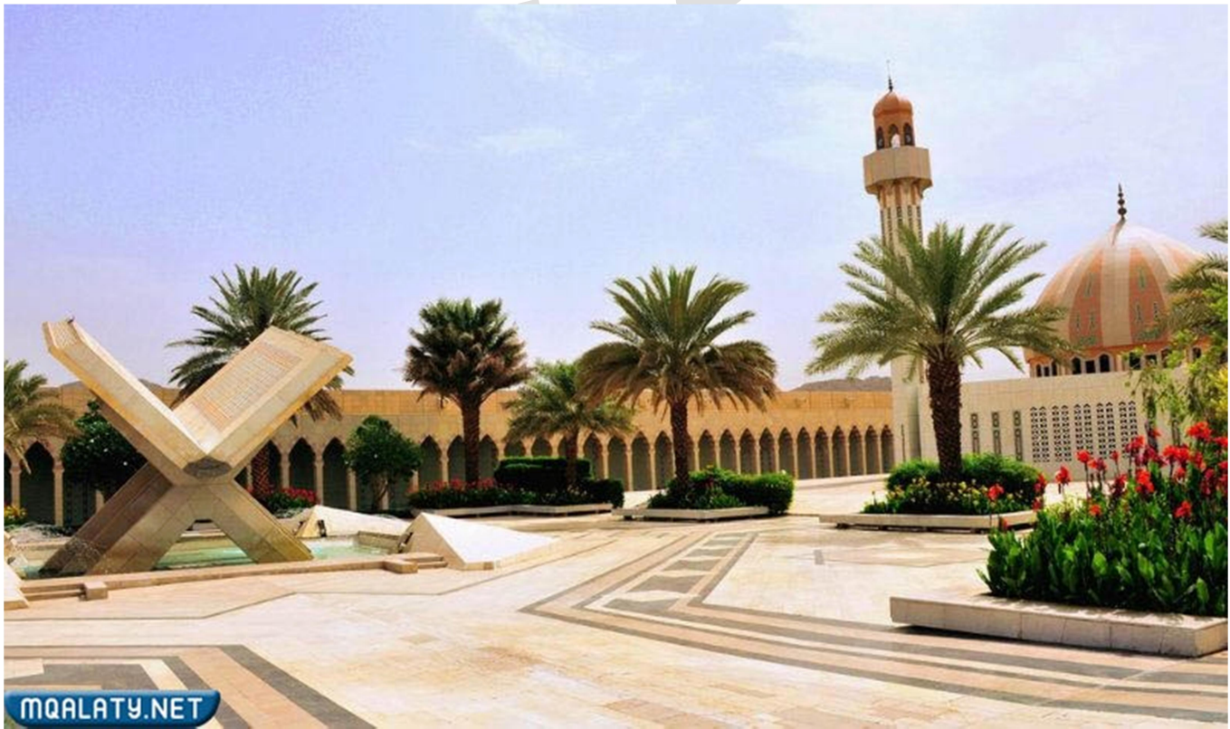
معلومات عن المدينة المنورة